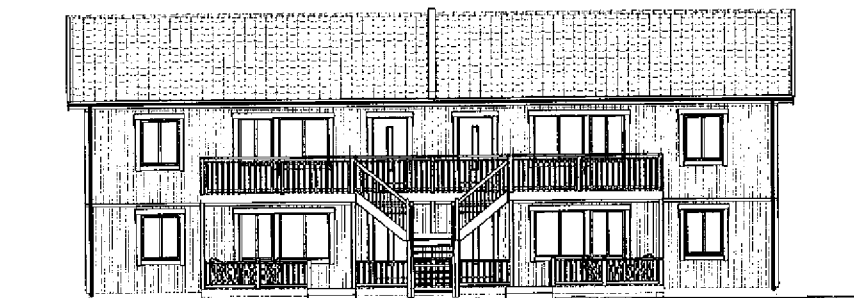
Fasad mot -----