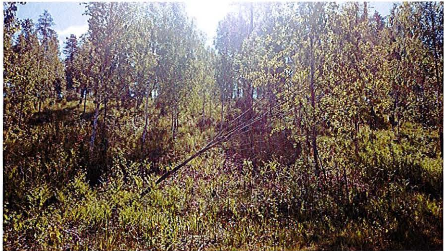
Vy mot åsen där tre till fyra villor kan komma att uppföras.

Fastighetsägaren har ansökt om detaljplaneändring för att kunna stycka av tomter för att uppföra villor för försäljning.