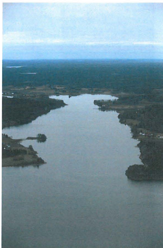
Dalälven vid Österviken.

Översiktsplanen med dess tematiska tillägg är vägledande men inte juridiskt bindande. För de flesta av de LIS-områden som föreslås i översiktsplanetillägget kommer detaljplan att behöva upprättas innan ny bebyggelse kan komma till stånd.