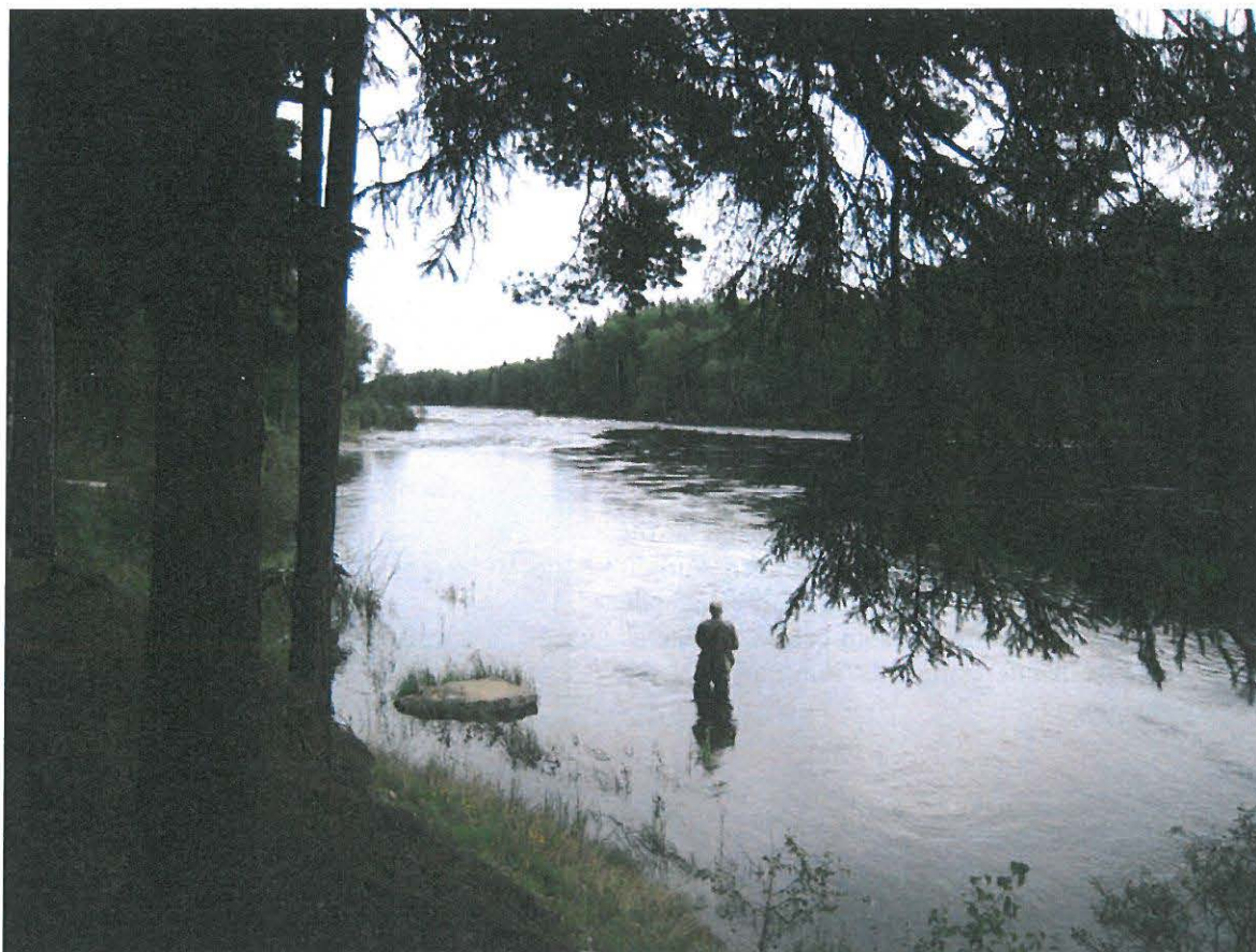
Nedre Dalälven är attraktiv för fritidsfiske.

Dalälven flyter genom kommunen och i anslutning till älven ligger bl.a. Avesta tätort, Krylbo, Karlbo, Folkkärna, Näs bruk och By.