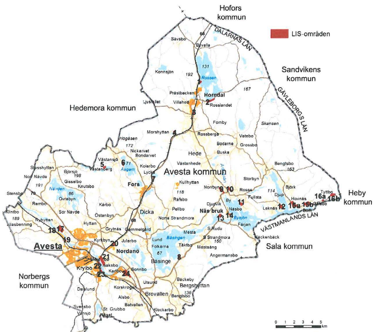
Avesta kommun med förslag till områden för landsbygdsutveckling i strandnära lägen (LIS).

I detta tematiska tillägg pekas 24 st LIS-områden ut, se karta nedan. Områdena syftar till att möjliggöra byggande av i första hand bostadsbebyggelse, men även anläggningar för friluftslivets behov eller för turism och konferens-/kursverksamhet.