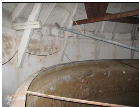
Figur 7. Den nitade cisternen med vissa rostangrepp.