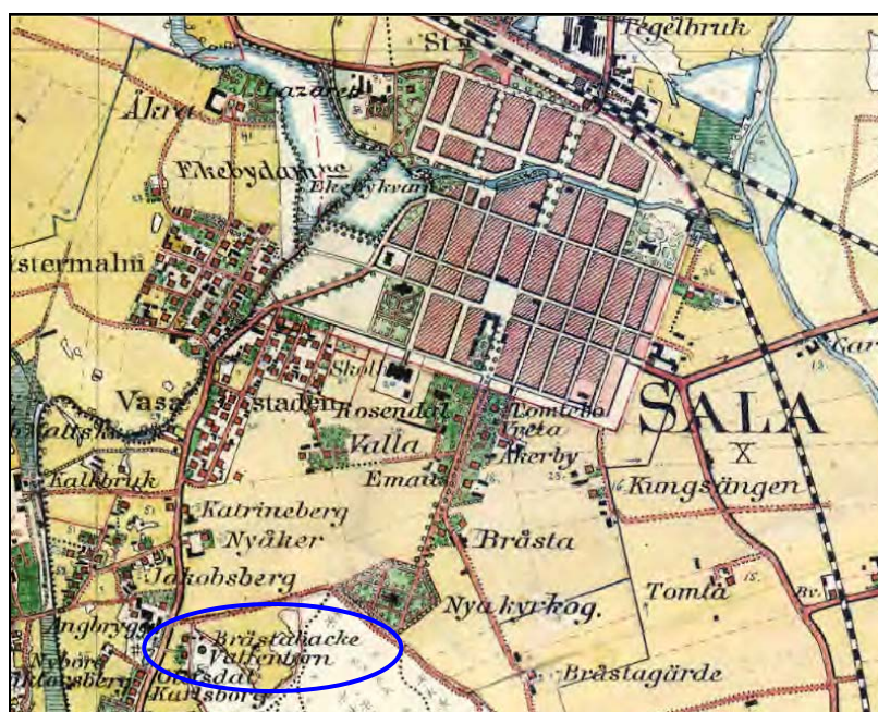
Figur 2. Vattentornet markerat på Häradsekonomska kartan från 1905-07. Vid uppförandetiden låg tornet strax utanför själva staden.