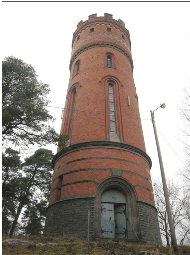
Figur 4. Vattentornet sett från norr.

Fortfarande finns dock ett stort mått av autenticitet kvar. Den stora rymd som bildas genom avsaknandet av bjälklag ger en god uppfattning av hur ett äldre vattentorn är konstruerat. Även cisternen och gångarna kring besitter en hög autenticitet.