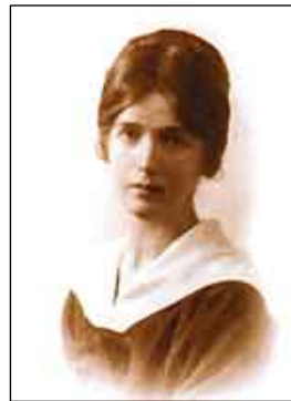
Figur 3. Agnes Magnell, ur: Från eftersatt till eftersökt.

Sala gamla vattentorn stod färdigt 1903 som stadens första vattentorn. Det ritades av Agnes Magnell (1878-1966), en av Sveriges första kvinnliga arkitekter. Magnell läste på KTH i Stockholm 1897-1901 som den första kvinnliga studenten på arkitekturutbildningen. 1 Kvinnor fick endast tillträde till KTH:s utbildningar i mån av plats och Agnes Magnells far var tvungen att skriva till regeringen för att få tillstånd att göra en ansökan för dotterns räkning. Hon beviljades så småningom plats efter att ha klarat ett offentligt inträdesprov i matematik inför ett stort antal skeptiska teknologer som åhörare. Efter utbildningen kom hon att tillsammans med sin man konstruera ett antal vattentorn och kraftstationer. Snart kom dock ansvaret för hem och barn att falla på henne och hon fick sluta vara verksam som arkitekt.