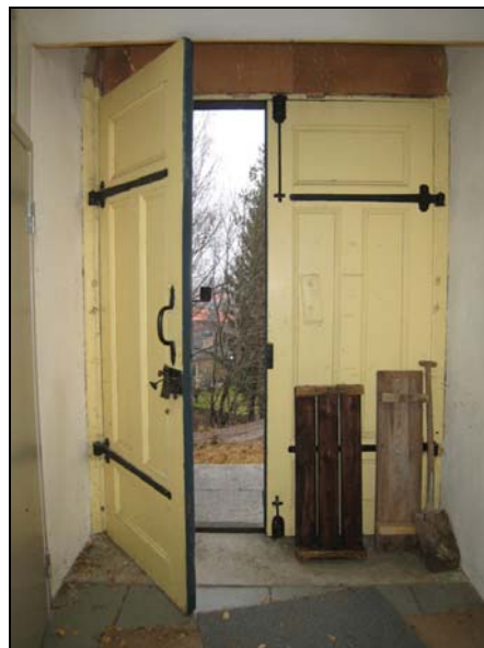
Figur 12. Dörrarna från insidan.