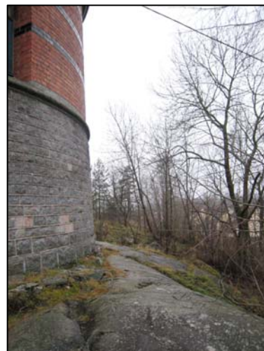
Figur 13. Brant sluttande hållmark i direkt anslutning till vattentornet.

Önskemål finns om att använda den gamla kulverten under vattentornet som entré till torent från det planerade garaget. Om detta är möjligt att genomföra utan påverkan på byggnaden eller omgivningen borde det inte vara något problem. Troligen kan det dock bli svårt att lösa placeringen av garaget i ett läge i närheten av kulverten. I första hand borde man sträva efter att placera garaget nedanför backen och endast ha en uppfartsväg med parkeringsplats uppe vid tornet. Som ett alternativ till detta skulle man eventuellt kunna tänka sig ett enkelt utformat garage på det flacka partiet söder om tornet. På södra sidan av tornet bör garaget störa upplevelsen av tornet mindre än på norra sidan där Bråstaskogens promenadstig har sin början.