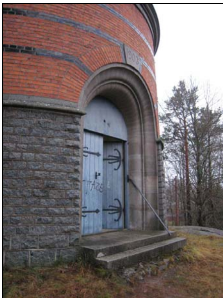
Figur 11. Entrén till vattentornet med pardörrar utsmyckade med karaktärsskapande smidesdetaljer.

Det är inte känt om man avser utföra någon form av isolering av väggarna. Installation av el, vatten och avlopp samt värme bör kunna utföras på ett sätt som är godtagbart ur antikvarisk synvinkel.