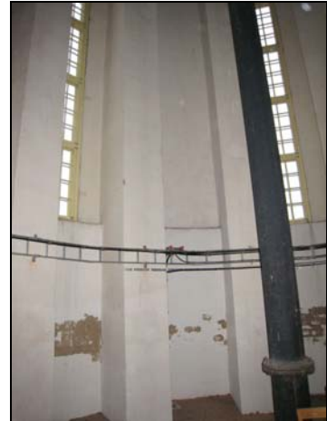
Figur 9. Tegelskadorna är omfattande. Stora frostsprängningar finns i synnerhet i tornets övre del.