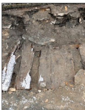
Virkesrester hittades vid grävarbeten vid södra sidan av Drottning Christinas schakt.

I samband med miljöåtgärder på södra infartsvägen vid Drottning Christinas schakt grävdes en virkeskonstruktion fram vid den södra sidan om laven. Virket kan vara en rest från den tidigare laven som byggdes i början av 1800-talet. Den laven var mycket större än nuvarande byggnad. I den norra delen av den tidigare laven anslöt den rälsbana som vi grävde fram vid arbeten vid det centrala gruvområdet.