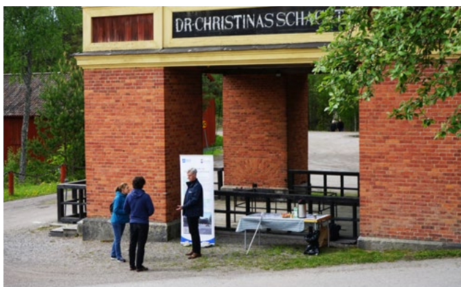
Information om projektet vid Saladagen vid Sala Silvergruva den 29 maj.

Den 26-28 augusti kommer representanter från projektet finnas på plats vid Salamässan för att svara på frågor, informera om projektet och fånga upp synpunkter. Kom gärna förbi och ta en kopp kaffe med oss.