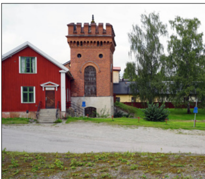
Nästa område som åtgärdas är Gruvkontorets parkering.

Fiskprovtagning har genomförts i Ekebydamm och under hösten inleds miljöprovtagning i Pråmån och längs med kanalens vallar.