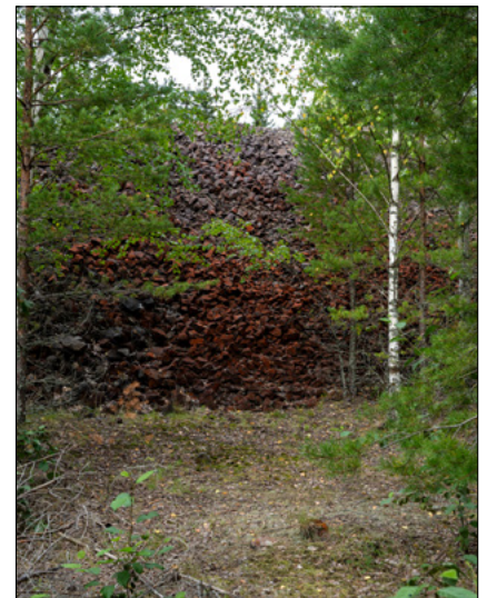
Planering inför åtgärder av Afterskansen pågår.

Samtidigt som vi åtgärdar flera områden fortsätter projekteringen av de kommande åtgärderna vid Krossplan och Hjulhuset, Aftersandshögarna och Slaggvarpen.