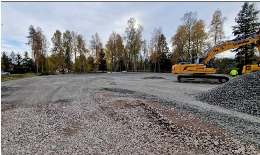
Åtgärder vid bussparkeringen sydväst om nedre parkeringen vid Sala Silvergruva. Marken har jämnats till och förbereds inför asfaltering.

I slutet av september påbörjade vi miljöåtgärder vid bussparkeringen sydväst om den nedre parkeringen. Området är det femte av nio områden som ska åtgärdas vid Sala Silvergruva. De åtgärder som genomförs är att vi jämnar till ytan, lägger ned dagvattenledningar med brunnar, fyller upp och sedan täcker med asfalt. Vi planerar även att starta arbeten vid ytterligare två områden under vintern.