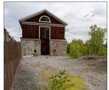
Projektering inför åtgärder vid Hjulhuset och krossplan har påbörjats.