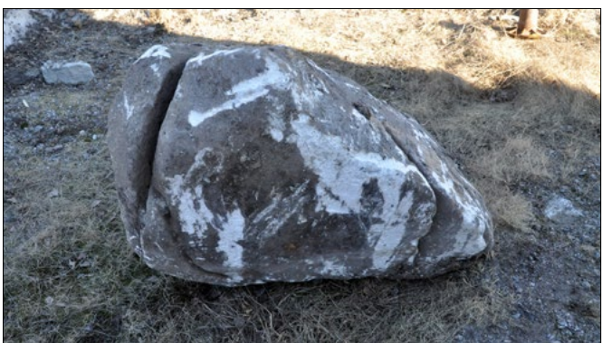
På området hittades också en sten med en skåra. Stenen kan ha använts som ett ankare.