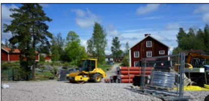
Miljöåtgärder vid vandrarhuset.

De miljöåtgärder som inleddes vid Vandrarhuset i februari är nu nästan helt klara. Marken har schaktats ur för att jämna till ytan. Därefter har vi lagt en bentonitmatta som ett tätande skikt. Över bentonitmattan har en ny överbyggnad skapats. Slutligen har marken täckts med ett slitlager grus. Arbetsberäkningar beräknas bli klara i juli och besiktigas senast i augusti.