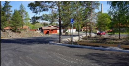
Den nedre parkeringen vid Sala Silvergruva kan nu användas av besökare.

Den nedre parkeringen är åtgärdad och besiktigad. Där har vi schaktat för att jämna till marken och därefter täckt ytan med en tät markduk, grus och asfalt. Entreprenaden avslutades i maj.