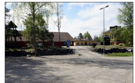
Grusplanen vid centrala gruvområdet.

I höst kommer kommunen att bjuda in berörda intressenter till en informationskväll. Mer information om detta kommer i nästa nyhetsbrev.