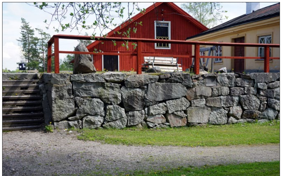
Nästa område som åtgärdas är centrala gruvområdet.

För att inte störa besöksverksamheten under sommaren gör nu projektet ett uppehåll i entreprenadarbetena. I början av september planerar vi att vara igång med miljöåtgärder vid Sala Silvergruva igen. Det område som står på tur i september är det centrala gruvområdet. Området sträcker sig från allén vid Dr. Christinas schakt, runt Silvergruvans reception (skrädhuset) och omfattar grusplanen mellan byggnaderna receptionshuset, stallet och vagnslidret.