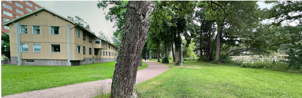
Foto av befintlig bebyggelse med Ekeby dammar i förgrunden. Längs med dammen går en allmän gångväg.