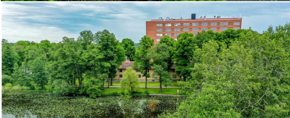
Flygbilder som visar relationen mellan befintlig bebyggelse och Ekeby dammar.